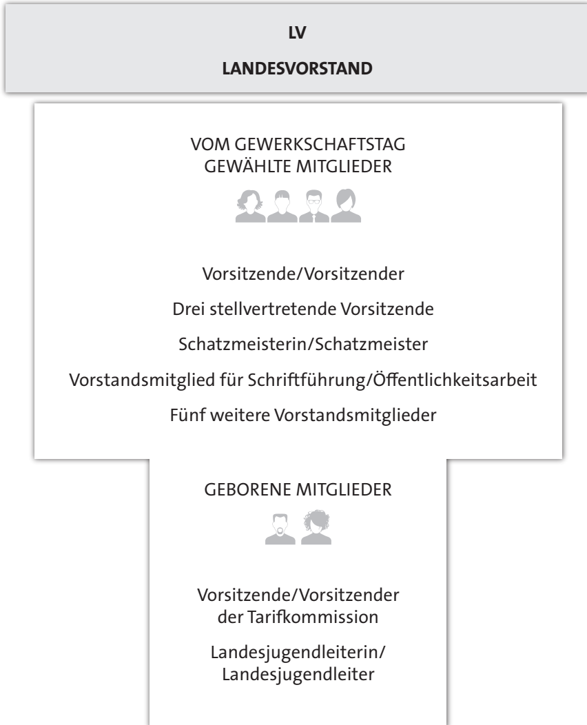
Schaubild: Zusammensetzung des Landesvorstand vdlb dbb